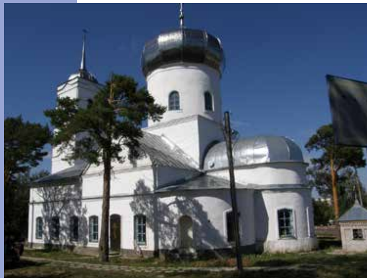
Московская обл. Храм Трех Святителей.

Краска SILIKAT-Fassadenfarbe рекомендована к использованию на памятниках архитектуры, в том числе храмах и церквях.