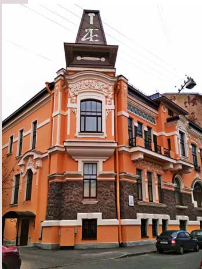
г. Санкт-Петербург ул. Литераторов д. 17 фасадная краска СИЛВЕРОН ТМ КАЙМАН 2017 г.