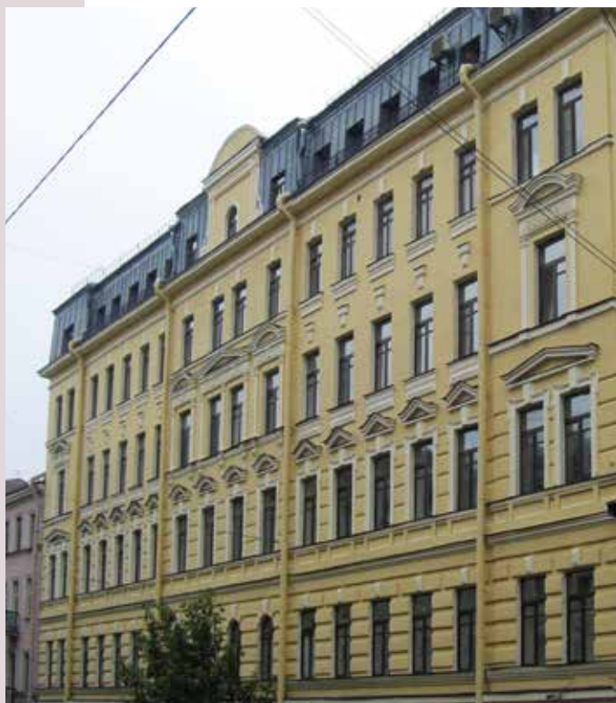
г. Санкт-Петербург ул. Верейская д. 30-32 фасадная краска СИЛВЕРОН, Universalfarbe RU, грунтовочный концентрат ТМ КАЙМАН 2017 г.