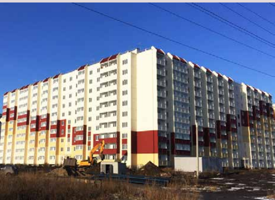
г. Омск, Амур-2, д. 12, д. 13 фасадная краска СИЛВЕРОН ТМ КАЙМАН 2017 г.